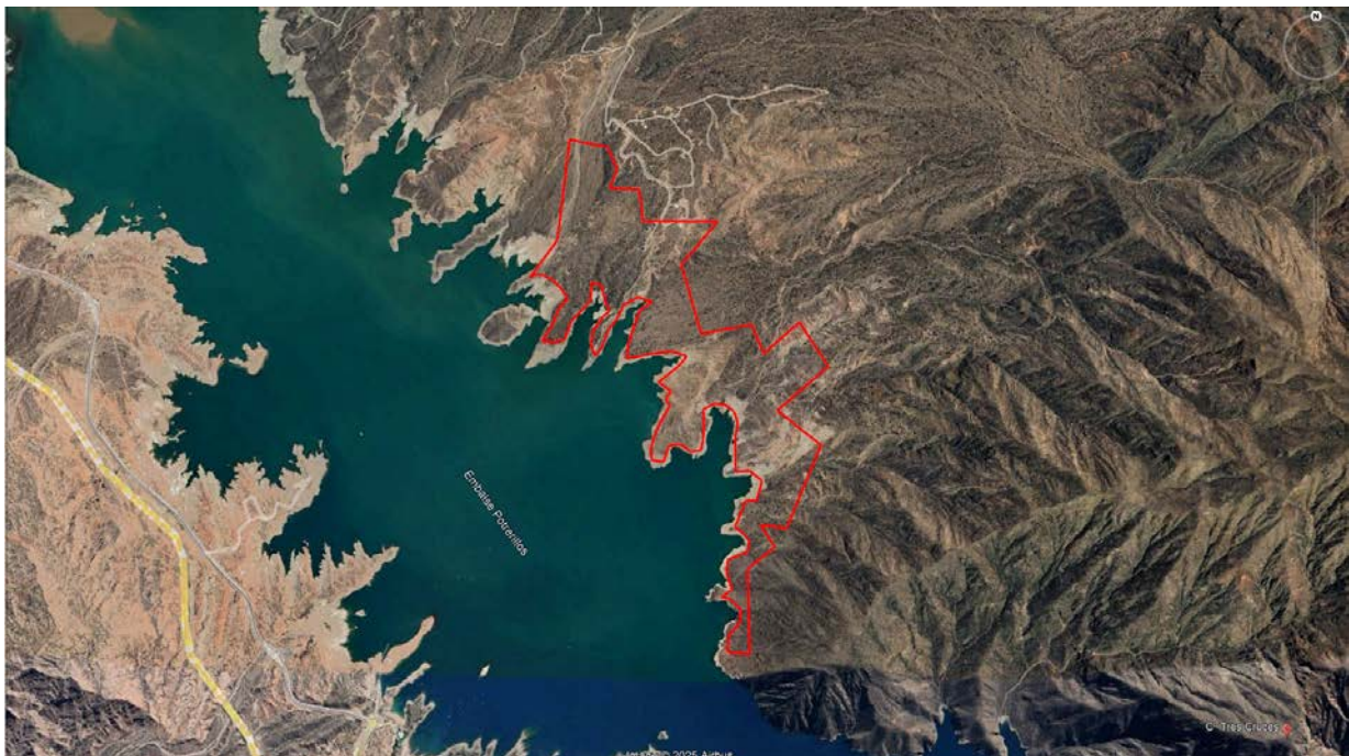
Fig. 1: Ubicación aproximada del proyecto en cuestión (polígono colorado)

Se accede a través de la Ruta Nacional N° 7, cruzando por el puente de hierro del antiguo ferrocarril hacia un camino de tierra que se encuentra en la costa norte del Dique Potrerillos.