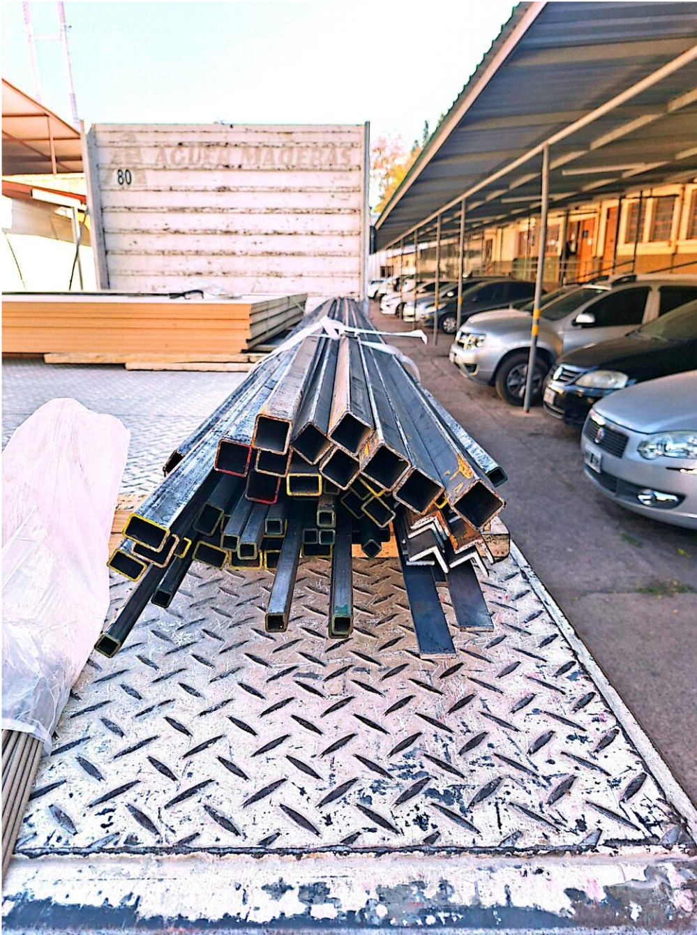
Imagen de los bienes correspondiente a los renglones 1, 3, 4, 9 y 13: