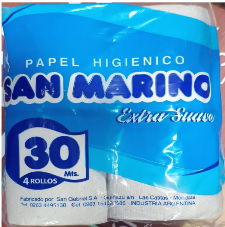
Imagen del renglón 95:

Se adjuntan, a la presente acta, imágenes de remito y mercadería correspondiente a la empresa proveedora.