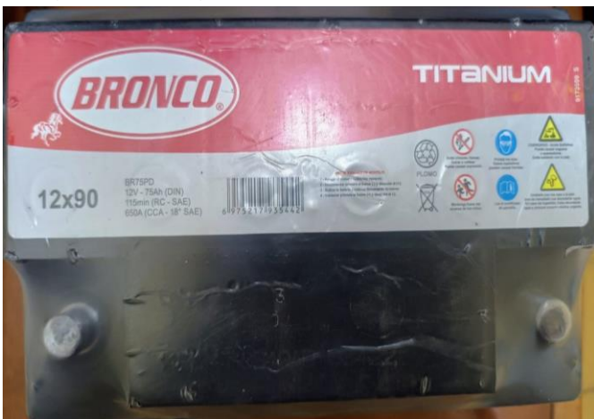
Imagen del renglón 69:

Se adjuntan, a la presente acta, imágenes de remito y mercadería correspondiente a la empresa proveedora.